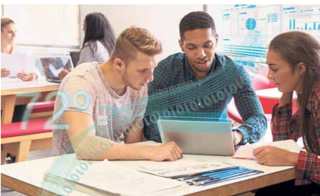
Auf die Bewerbung für den Start in den Job sollte man sich gut vorbereiten.

Bei der Vorstellung für den Ausbildungsplatz ist gute Vorbereitung enorm wichtig