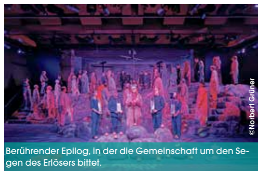
Berührender Epilog, in der die Gemeinschaft um den Segen des Erlösers bittet.