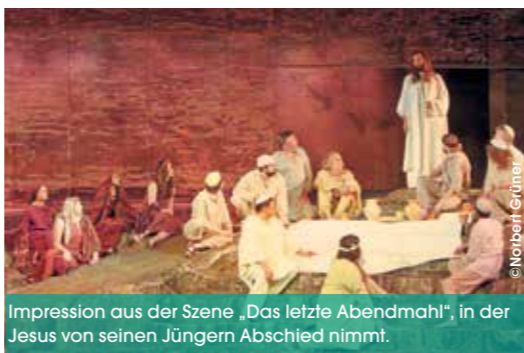
Impression aus der Szene „Das letzte Abendmahl“, in der Jesus von seinen Jüngern Abschied nimmt.