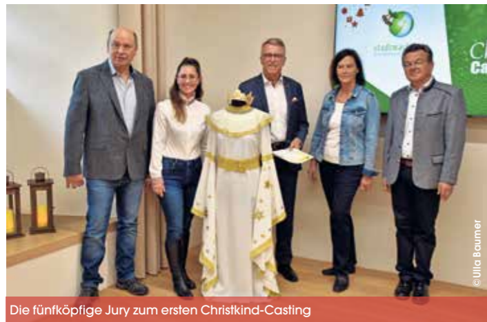
Die fünfköpfige Jury zum ersten Christkind-Casting