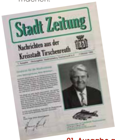
01. Ausgabe am 01. Oktober 1999

Was wünschen Sie sich für die Zukunft des Stadtmarketingvereines? Ich wünsche mir viele, vor allem jüngere neue Mitglieder, die auch bereit sind, sich mit Tatkraft und guten Ideen in Projekte und Aktionen des Stadtmarketingvereins einzubringen.