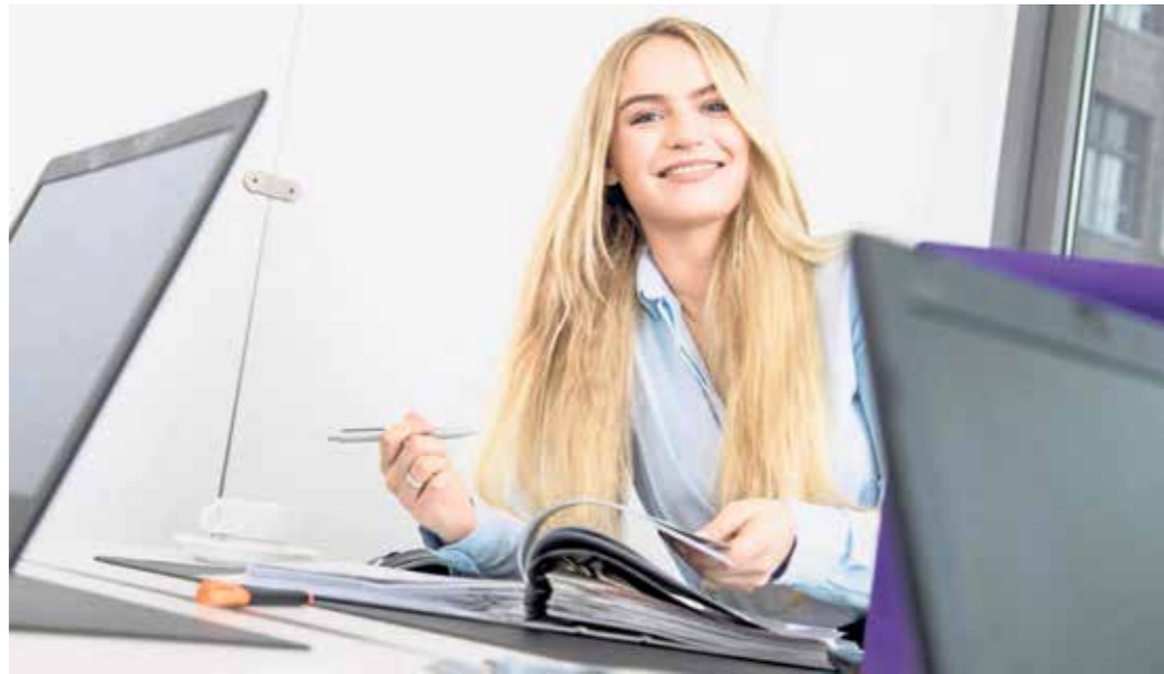
Kleiderregeln haben durchaus ihre positiven Seiten.

Die Kleiderordnung ist aber nicht nur eine Frage individueller Geschmackssicherheit: