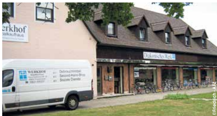
Hier finden langzeitarbeitslose Menschen eine sinnstiftende Beschäftigung: Sozialkaufhaus „Werkhof Stiftland“

Aber es gibt im Werkhof auch eine zweite Seite der Unterstützung, welche vielen Kunden nicht bekannt ist: Das Sozialkaufhaus ist eine soziale Beschäftigungsmaßnahme. Es finden dort Frauen und Männer eine sinnstiftende Beschäftigung, welche auf dem regulären Arbeitsmarkt nur schwer eine Stelle finden können. Die Gründe dafür sind so vielfältig wie die Menschen, die es betrifft. Der 60-jährige Porzellaner hat ein Leben lang im gleichen Betrieb gearbeitet, bis dieser aufgrund des Strukturwandels dichtgemacht hat. Die 40-jährige Bürogehilfin hat eine chronische Erkrankung, bei dessen Erwähnung im Bewerbungsgespräch dieses auch schon wieder beendet ist. Der Dritte hatte nie die Möglichkeit einen qualifizierenden Schul- und Berufsabschluss zu machen und hat es deshalb selbst in Zeiten vermeintlicher Vollbeschäftigung schwer, einen regulären Job zu finden. Immer häufiger führt schon allein das Lebensalter,