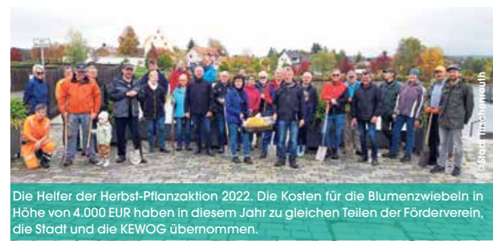
Die Helfer der Herbst-Pflanzaktion 2022. Die Kosten für die Blumenzwiebeln in Höhe von 4.000 EUR haben in diesem Jahr zu gleichen Teilen der Förderverein, die Stadt und die KEWOG übernommen.

Kontakt, Info und Anmeldung unter Fitness am See, Platz am See 1, 95643 Tirschenreuth, Tel.: 09631/300 79 80, fichtner@vdnowas.de, www.fas-fitnessamsee.de