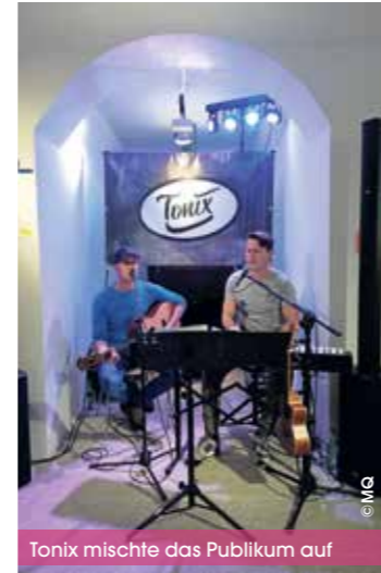
Tonix mischte das Publikum auf