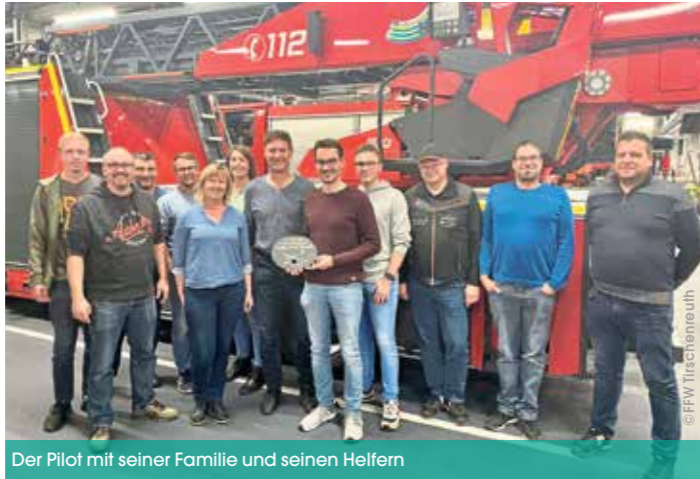
Der Pilot mit seiner Familie und seinen Helfern

Ein Zeuge soll diesen Absturz beobachtet haben. Aber auch bei der Leitstelle für Flugsicherung lief ein automatisch ausgelöster Notruf auf, welcher ahnen ließ, dass dies wohl kein Fehlalarm sein würde. Als die Feuerwehren aus Ottengrün, Poppenreuth, Bad Neualbenreuth, Waldsassen und Tirschenreuth ankamen, kreisten bereits Hubschrauber über dem Waldgebiet. Einer davon war der SAR-Hubschrauber der Bundeswehr, welcher die abgestürzte Maschine später orten konnte. Da man von oben durch die Baumkronen nur schwer etwas erkennen konnte, begann die Suche vom Boden aus. Kurze Zeit später erkannte ein Fahrzeug der Tirschenreuther Wehr, von einem Waldweg aus, etwas Schimmerndes im Wald. Es war der weiß-rote Fallschirm, mit dem sich der Pilot aus dem Flugzeug retten konnte und sich in den Bäumen verfangen hatte. Dabei dürfte die erhöhte Sitzposition im Löschfahrzeug sowie der richtige Lichteinfall erheblich zur Sichtung beigetragen haben. Etwa 200 Me-